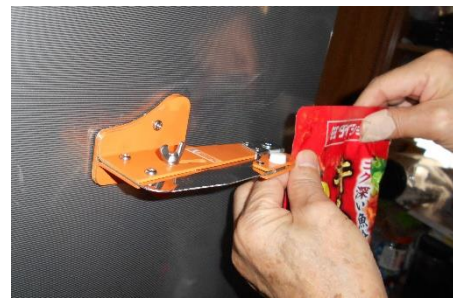
横で使用してだし汁のパックをカット

縦でカット出来る物： 牛乳の紙パック、ポテトチップスの筒、キッチンペーパーの芯、酒の紙パック等