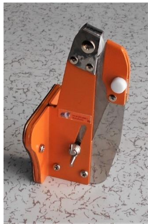
アタッチ セイフティーカッター