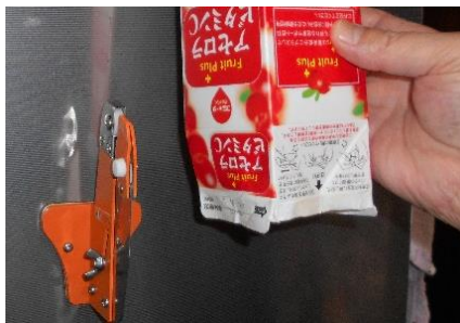
縦で使用してジュースの紙パックをカット