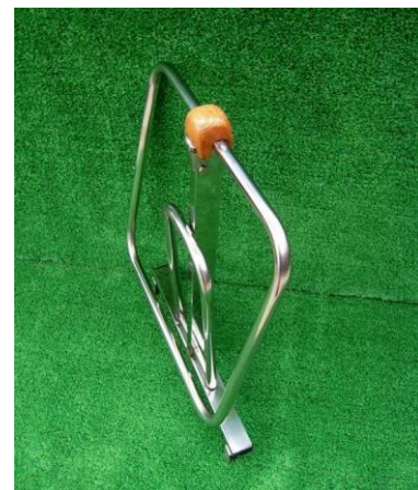
折り畳んだエコポリスタンド