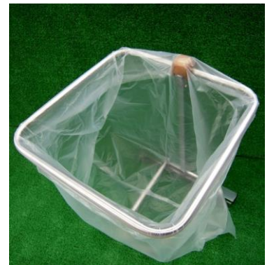
ポリ袋をつけたエコポリスタンド